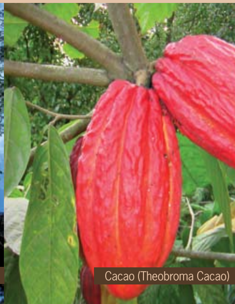
Cacao ( Theobroma Cacao )