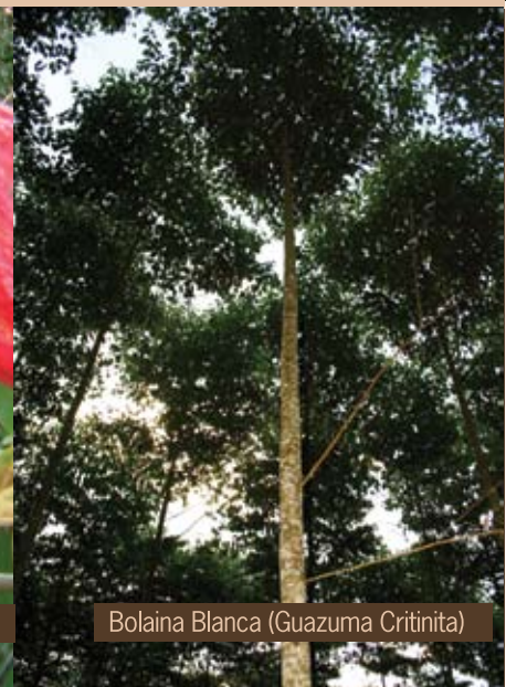
Bolaina Blanca ( Guazuma Critinita )